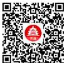
京通支付宝小程序图