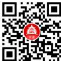
京通百度小程序图

△ 进入京通|健康宝小程序后，在页面底部应用导航栏中，点击【北京通】，进入京通应用主页。